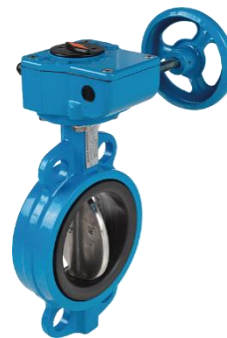
Tipo 9941 AW