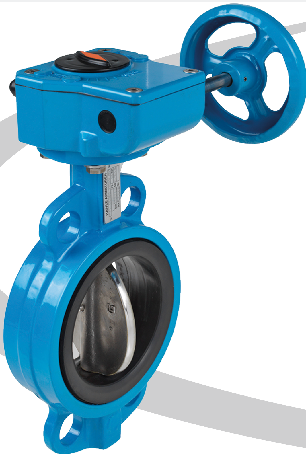
Valvola a farfalla con ingranaggio, tipo AW, PN 16®