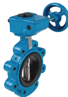
Tipo 9943 LT