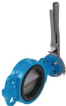
Tipo 9940 AW

Attenzione: il raccordo diretto con flange bordate non funziona. (Raccordo flangiato non a tenuta stagna)