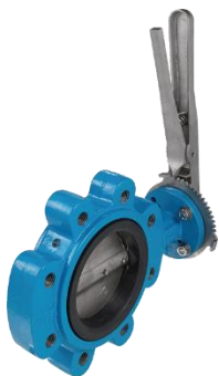
Tipo 9942 LT