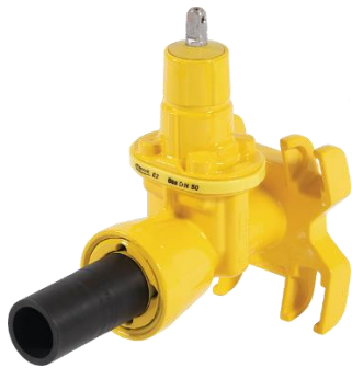
Slitta di maschiatura Uni-Hawlinger ad es. No. 2405 / 2435