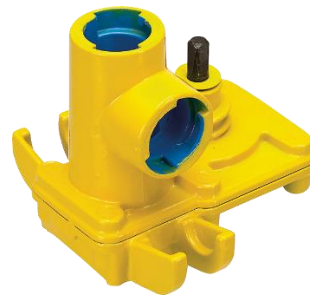
Slitta die maschiature Uni-Hawlinger No 2288 / 2295