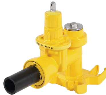
Slitta di maschiatura Uni-Hawlinger ad es. No. 2445 / 2455