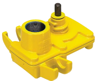
Slitta di maschiatura Uni-Hawlinger No. 2285