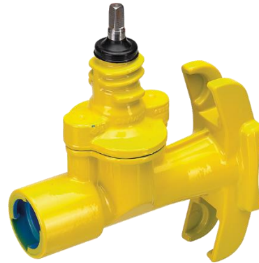
Slitta di maschiatura Robusto. ad es. No. 2735