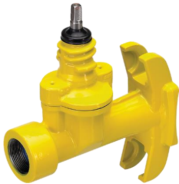
Slitta di maschiatura Robusto. ad es. No. 2726