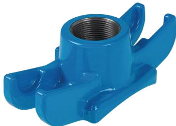
Uni Anbohrschelle Flansch Nr. 3510

Uni-Anbohrschellen z. B. Nr. 3520 / 3521 / 3522 Uni-Anbohrsperrschellen z. B. Nr. 3710 / 3711