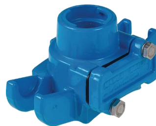
Uni-Anbohrschelle Flansch z. B. Nr. 3511 / 3680