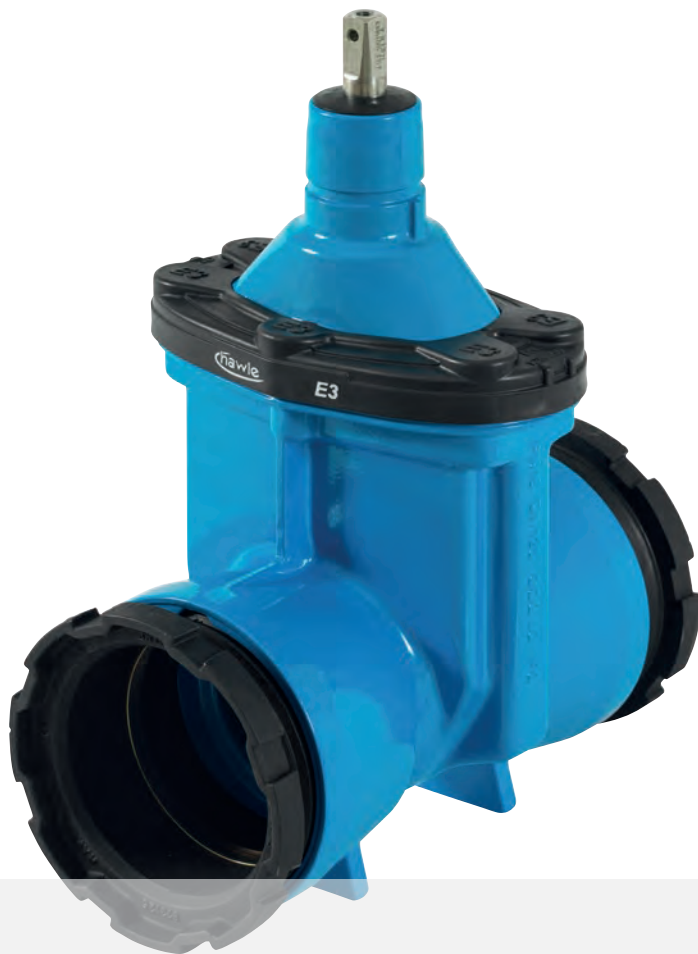
Manchons à vis